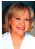
Psychologue clinicienne, formatrice et expert judiciaire